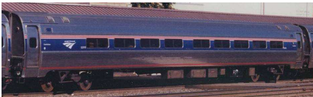
Amfleet II coach phase

17 posti Lounge con 8 tavoli che possono servire un totale di 32 passeggeri con uno snack bar.