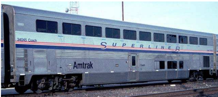
Carrozza tipo Superliner coach ( fase IV 1998 )