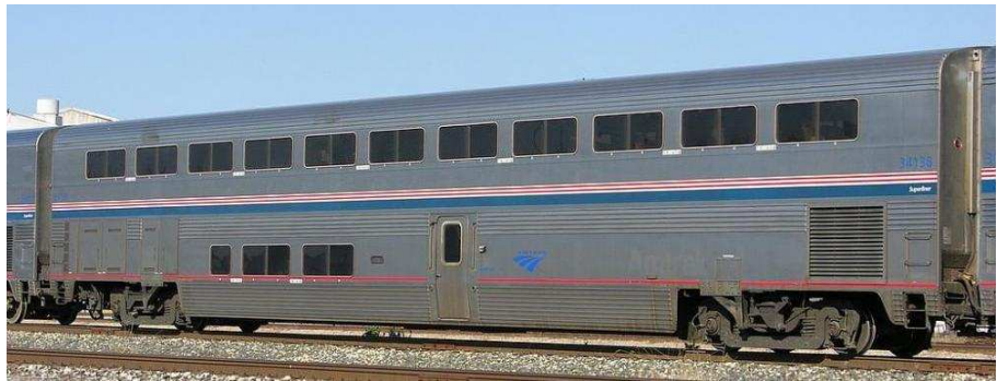
Superliner Coach fase V

Lunghezza m 25,9 Altezza m 4,9 Peso ton 67 Costruite 479