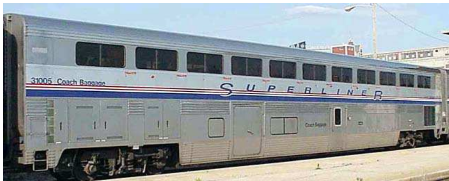
Carrozza tipo Superliner coach-baggage car. ( fase IV 1999 ) .

Questi carri di derivazione dai box car sono molto utilizzati lungo i treni transcontinentali, in testa o spesso in coda al treno per facilitare le manovre e vengono utilizzati per il trasporto di posta, pacchi espresso e bagagli. Sono stati prodotti in diverse serie con caratteristiche diverse, tutti comunque predisposti con condotte per riscaldamento richieste dal servizio passeggeri. I carrelli sono del tipo GSC come le carrozze.