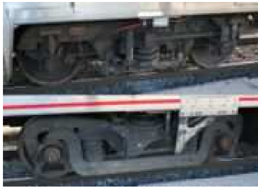
Carrelli Sopra: I serie Minden Sotto : II serie GCS