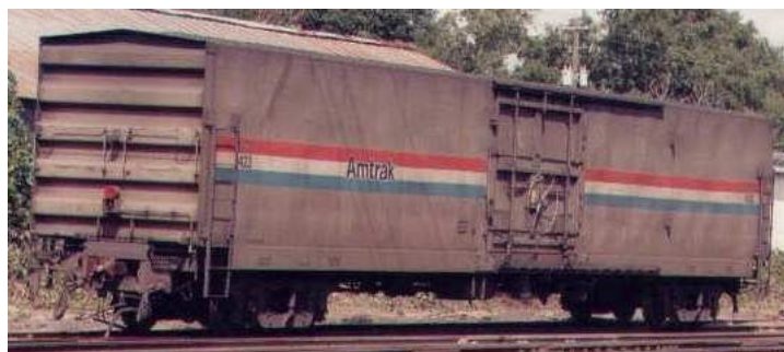
Carro tipo MHC (fase II 1985)